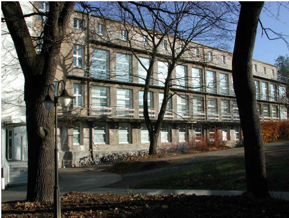
Bettenhaus 2 vor Beginn 2.BA ( 1998)