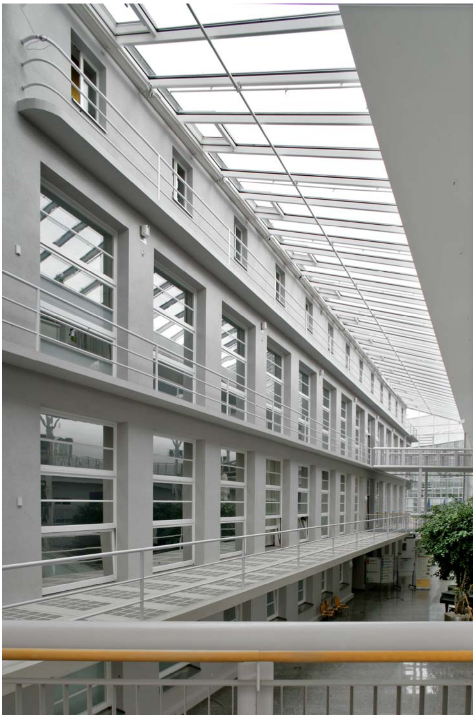
Bettenhaus Südfassade nach Fertigstellung 2.BA (2003)