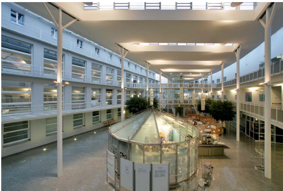
Zentrale Halle mit Bettenhaus 2 nach Fertigstellung 2.BA (2003)