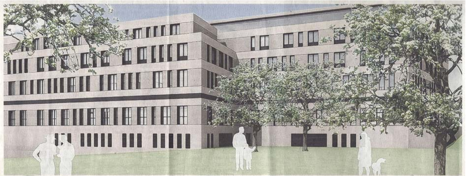
So in etwa kann er im Nordosten des Areals aussehen – der erste Bauabschnitt des neuen Gesundheitsparks an der Robert-Koch-Straße.