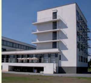
Bauhausgebäude in Dessau

Das Plakatmotiv erhalten Sie als hochwertigen Sonderdruck in DIN A3 ab einer Spende in Höhe von € 50,-! Spendenkonto bei der Sparkasse Schweinfurt - Konto 21 16 53 94 - BLZ 793 501 01 - Bitte Adresse für Spendenquittung angeben.