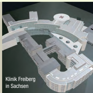
Klinik Freiberg in Sachsen