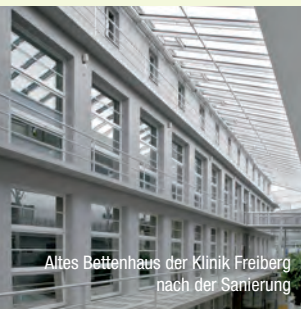
Altes Bettenhaus der Klinik Freiberg nach der Sanierung